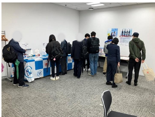
↑不動産流通推進センターの事業紹介ブース